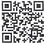
QR Code ลงทะเบียนส่งผลงาน